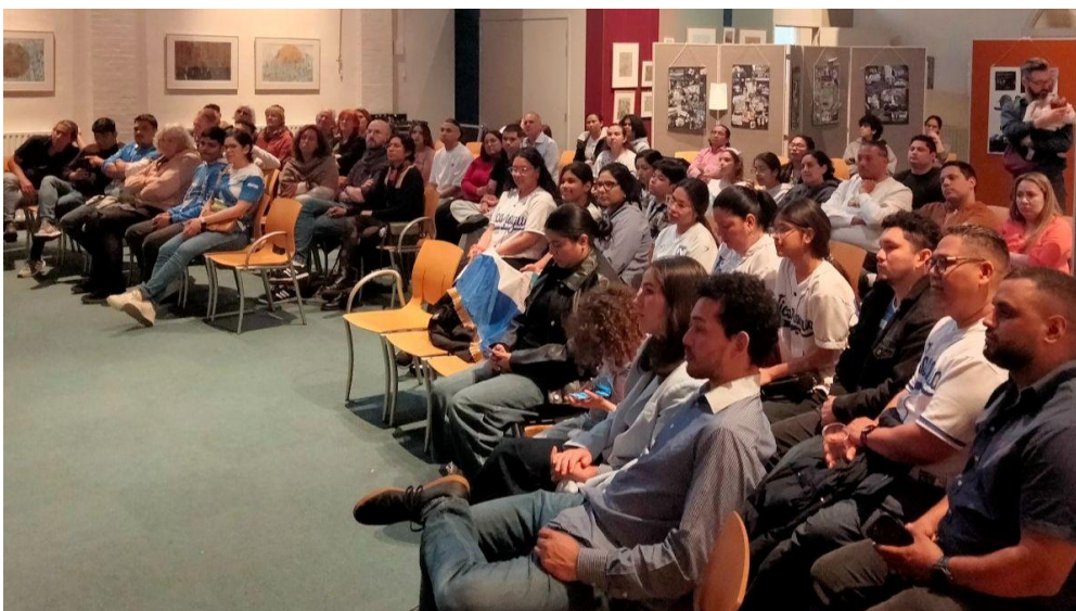
Aprilherdenking op 21 april 2025 in Kerk en buurthuis Bethel, Den Haag.

De bijeenkomst was een groot succes met zeker 90 bezoekers, merendeels Nicaraguaanse vluchtelingen.