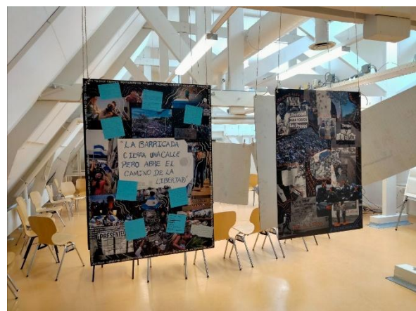
Presentatie van het protestarchief op 16 april 2025, ISS, Den Haag.